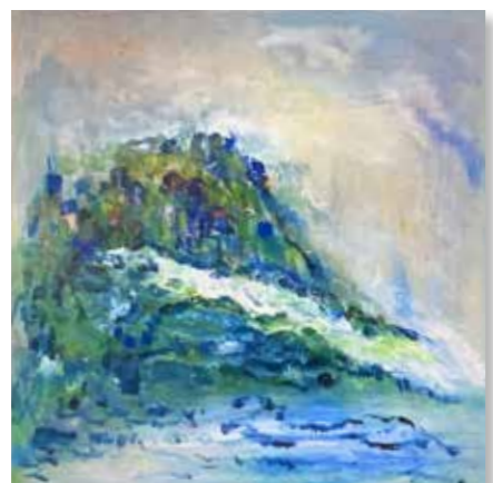
OKTOBER-NOVEMBER: Inge Højstrup