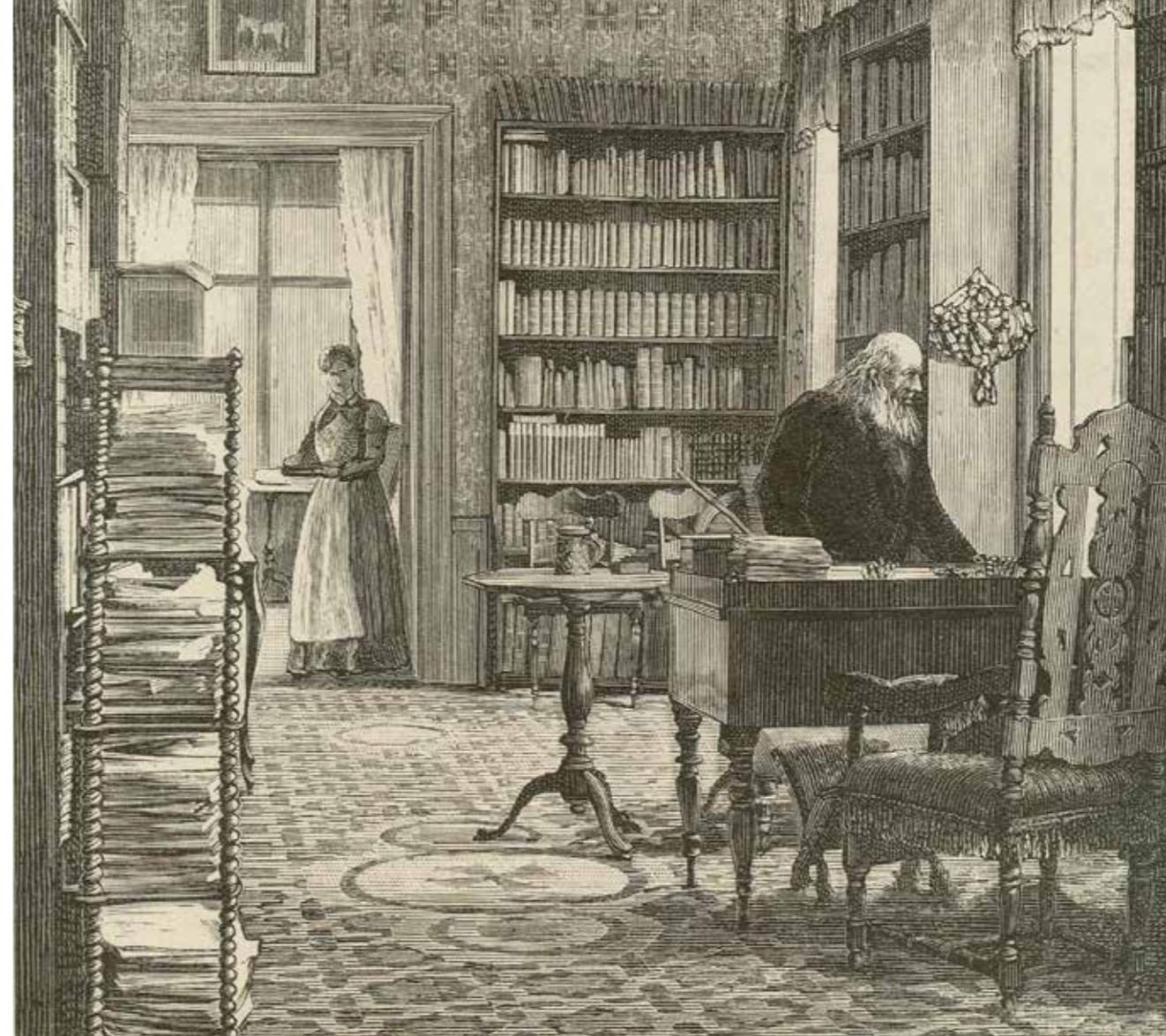
Grundtvig i sit arbejdsværelse på Store Tuborg.

Men for Grundtvig var et oplyst folk vejen til, at der ikke skete den samme uro i Danmark, som der gjorde ved Den Franske Revolution i 1789. På Grundtvigs tid var der nemlig oprørsstemning i Europa, fordi befolkninger krævede større selvbestemmelse i deres lande. Store nationalfølelser blev grundlagt, og for at den nye selvbestemmelse skulle finde