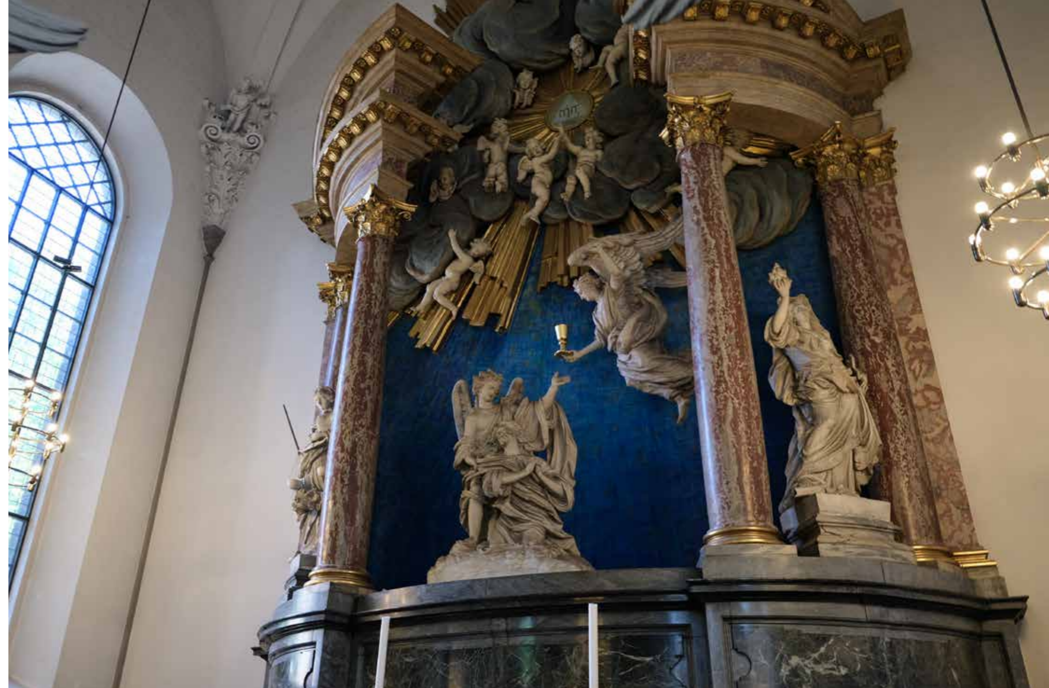
På Vor Frelsers Kirkes alter kan man se Kristus blive trøstet af engle.

Julen er glæden, hjerternes og børnenes fest. I forventningens glæde vil de danse gennem december med tændte julelys i øjnene og allerstærkest juleaften. Der har de deres tanker på at give de gaver, de selv har produceret i børnehaven og i skolen, og i spændt forventning om, om de nu selv får de største ønsker opfyldt. Ve den, der tænker ilde om den barnlige forventning og juleglæde. Den er en del af Guds gode vilje, nemlig evnen til at give sig hen i glad forventning og håb til det, der kommer. Evnen til nu at være helt nærværende i glæden og indleve sig i, hvordan hyrderne vandrer til stalden og dér møder Jesusbarnet i krybben. Alt imens vi sammen knæler ned i ærefrygt og med taknemmelighed over den store glæde, der skal være for folket. Denne barnlige glæde springer direkte ud af englesangen fra himlen, tror jeg. Og ingen skal tage den fra den, der tør give sig hen til den! Hører du til dem, der er givet evnen til at glædes